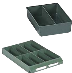
Ejemplo de composición. No incluye cajón.

Exteriores: (HxAxF) 41 x 111 x 154 mm Capacidad cajón: 4 Material: Poliestireno Color: verde Peso: 0,07 Kg