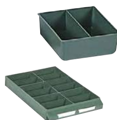
Ejemplo de composición. No incluye cajón.

Exteriores: (HxAxF) 41 x 111 x 103 mm Capacidad cajón: 6 Material: Poliestireno Color: verde Peso: 0,05 Kg