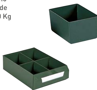
Ejemplo de composición. No incluye cajón.

Exteriores: (HxAxF) 82 x 111 x 154 mm Capacidad cajón: 4 Material: Poliestireno Color: verde Peso: 0,10 Kg