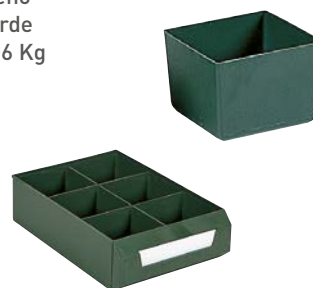
Ejemplo de composición. No incluye cajón.

Exteriores: (HxAxF) 82 x 111 x 103 mm Capacidad cajón: 6 Material: Poliestireno Color: verde Peso: 0,06 Kg