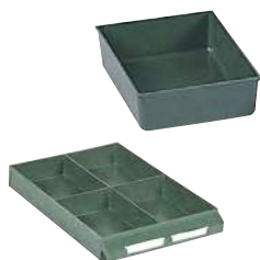
Ejemplo de composición. No incluye cajón.

Exteriores: (HxAxF) 41 x 111 x 154 mm Capacidad cajón: 4 Material: Poliestireno Color: verde Peso: 0,06 Kg