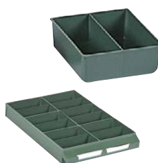
Ejemplo de composición. No incluye cajón.

Exteriores: (HxAxF) 41 x 111 x 103 mm Capacidad cajón: 6 Material: Poliestireno Color: verde Peso: 0,05 Kg