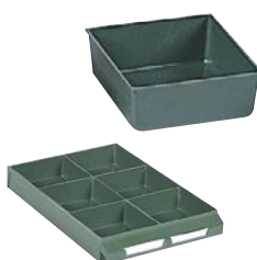
Ejemplo de composición. No incluye cajón.

Exteriores: (HxAxF) 41 x 111 x 103 mm Capacidad cajón: 6 Material: Poliestireno Color: verde Peso: 0,04 Kg