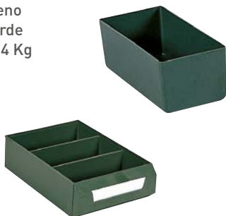
Ejemplo de composición. No incluye cajón.

Exteriores: (HxAxF) 82 x 220 x 103 mm Capacidad cajón: 3 Material: Poliestireno Color: verde Peso: 0,14 Kg