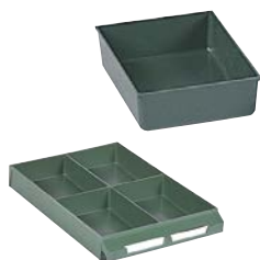
Ejemplo de composición. No incluye cajón.

Exteriores: (HxAxF) 41 x 111 x 154 mm Capacidad cajón: 4 Material: Poliestireno Color: verde Peso: 0,06 Kg