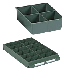
Ejemplo de composición. No incluye cajón.

Exteriores: (HxAxF) 41 x 111 x 103 mm Capacidad cajón: 6 Material: Poliestireno Color: verde Peso: 0,06 Kg