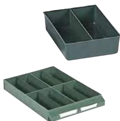
Ejemplo de composición. No incluye cajón.

Exteriores: (HxAxF) 41 x 111 x 154 mm Capacidad cajón: 4 Material: Poliestireno Color: verde Peso: 0,07 Kg