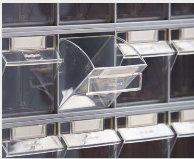
Detalle del cajón basculante

Los contenedores basculantes BASBOX se componen de un armazón plástico y cajones basculantes transparentes. El número y tamaño de los cajones varía en función del modelo. Existen seis modelos diferentes, equipados con 2 hasta 9 cajones. La transparencia de los cajones proporciona una rápida visualización del contenido, facilitando el uso y optimizando tiempos en preparación de pedidos.