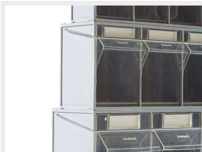
Detalle de las varillas de seguridad